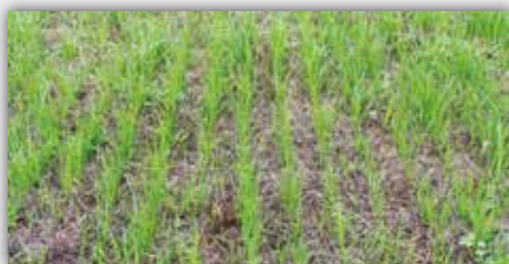
Durante Vredo (Giorno 13)