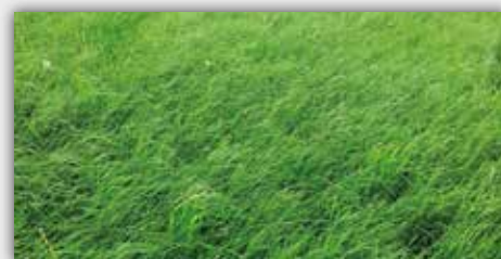
Dopo Vredo (Giorno 31)